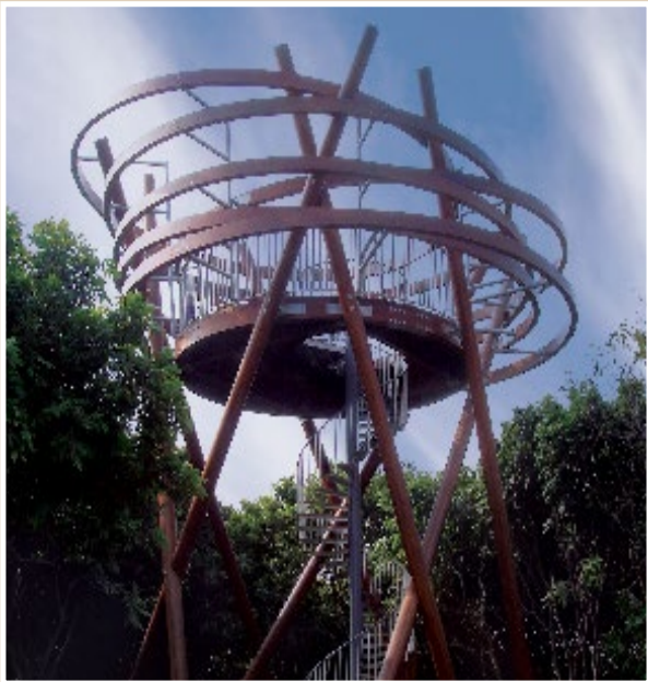
厦门五缘湾湿地鸟类观测站