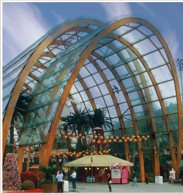
成都欢乐谷游乐园入口